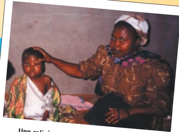
Une religieuse congolaise rend visite aux enfants hospitalisés

Située à 525 km au sud-ouest de Kinshasa, KIKWIT est l'axe routier central et principal pour se rendre dans les deux provinces du KASAÏ, dans la province du KATANGA et en ANGOLA par Kahemba, Kingwangala.