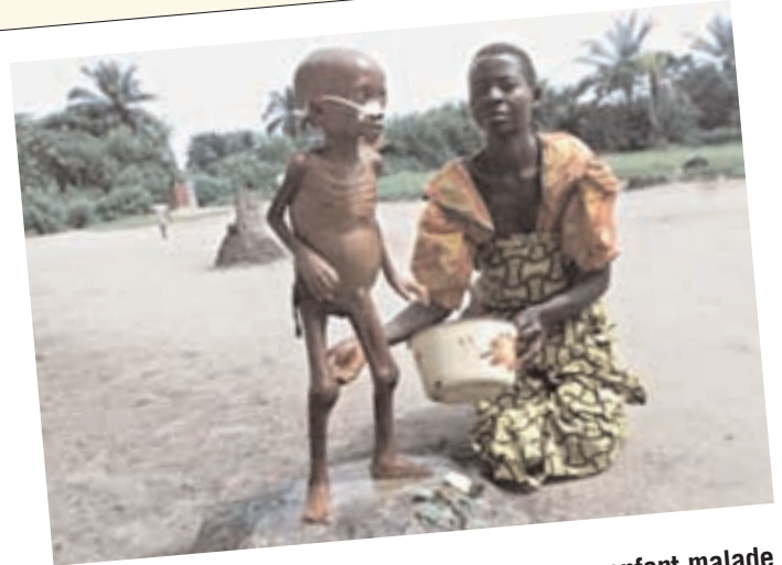
Une maman congolaise en train de laver son enfant malade avec quelques gouttes d'eau dans un pays où l'eau est la première richesse à la portée de tous. La guerre l'empêche de conduire son petit à la source.

que la ville contient encore comme espace vide et se transforme en brouillard pour les rares automobilistes. Les enfants qui viennent jouer dans ces espaces sont souvent victimes des accidents des automobilistes qui ne les voient pas.