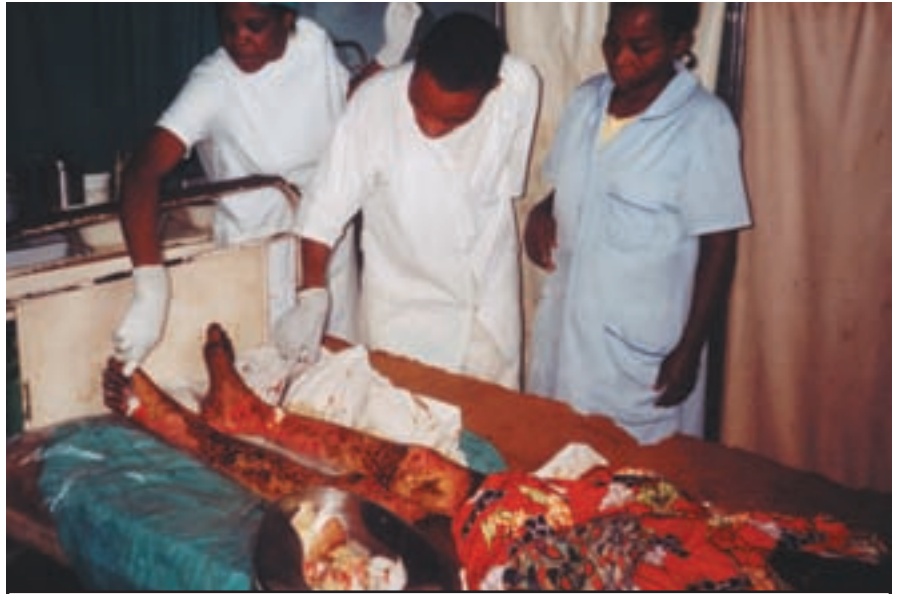
Un brûlé pris en charge à l'hôpital Sia (diocèse de Kikwit)

Aide à l'acquisition d'un véhicule pour le transport des malades