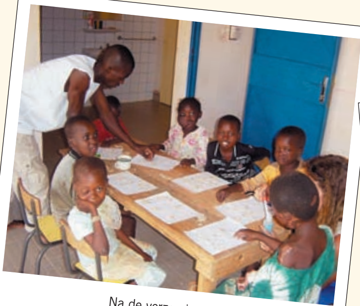
Na de verzorging leren de kleinsten ook tekenen.

Ariane Vuagniaux, vertegenwoordigster en verblijvend in Ouagadougou