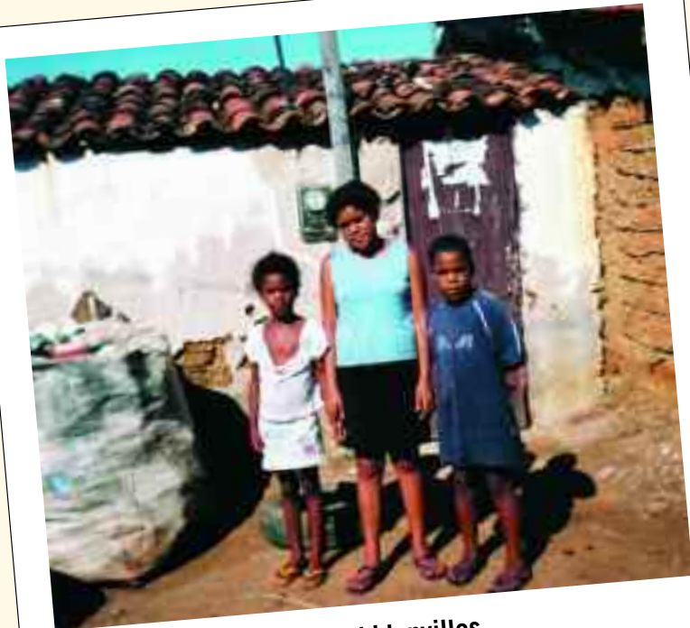
Dans les bidonvilles, les ordures s'entassent à côté des "habitations"

rien dans les ordures des favelas que la misère et la violence.