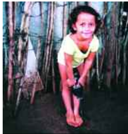
Malgré la pauvreté, les enfants gardent le sourire

BRESIL : aidons le Père Grégoire à continuer à secourir, alimenter, soigner, éduquer des centaines de petites victimes pour les sortir de la misère et de la violence des bidonvilles.