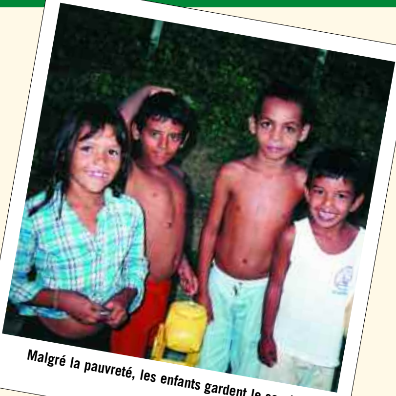
Malgré la pauvreté, les enfants gardent le sourire

Comme vous le devinez, alimenter chaque jour ces petits affamés, en plus des vêtements, de l'hygiène, et tout le reste, car il n'y a pas qu'eux qui ont besoin d'aide, les plus âgés aussi, et certaines familles en grande détresse ... c'est un casse-tête !