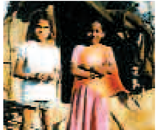
Deux enfants accueillies au Home, d'origines ethniques différentes

construction de 2 blocs de dix toilettes pour les enfants du Home St-Joseph