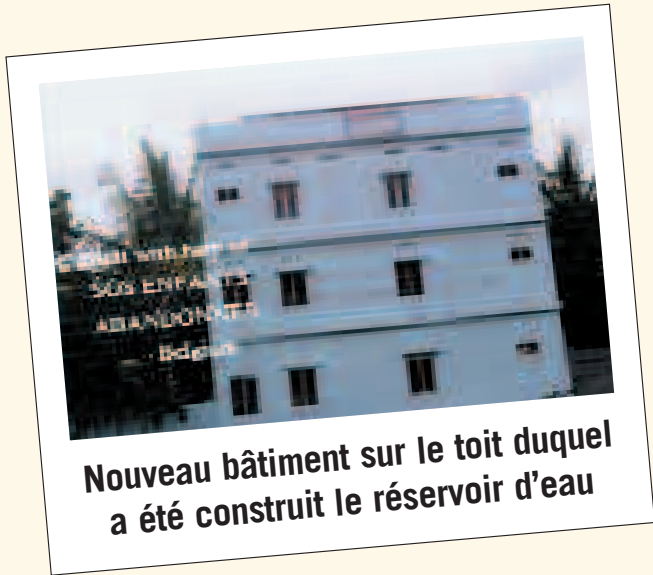
Nouveau bâtiment sur le toit duquel a été construit le réservoir d'eau

Là-bas, à Vellaturu, le village paroissial situé non loin du Home, les enfants sont assis par terre, avec parfois un papier et un crayon entre les mains.