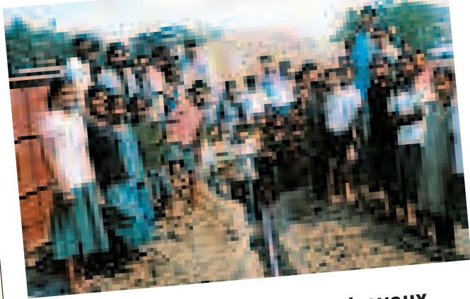
Les enfants pendant les travaux d'installation des tuyauteries d'eau

Les enfants de santé fragile ainsi que les personnes âgées ne survivent pas à des températures pareilles.