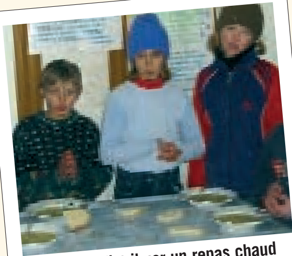
Pouvoir distribuer un repas chaud par jour aux plus démunis