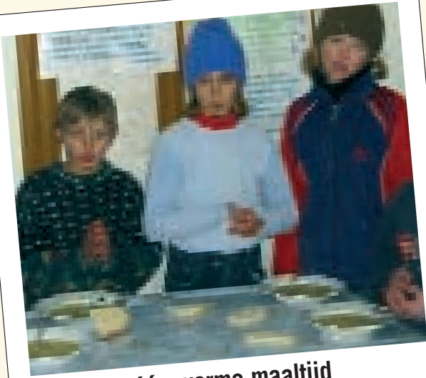
één warme maaltijd per dag kunnen geven