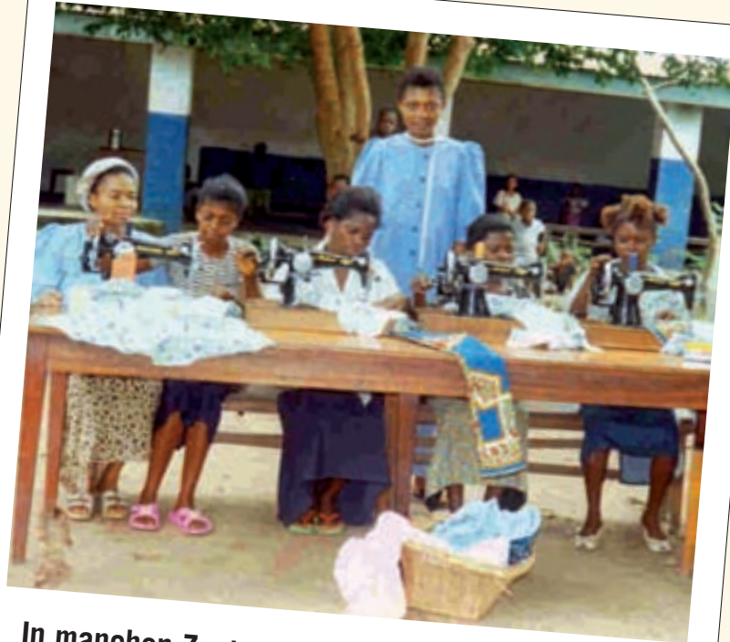
In manchen Zentren erlernen junge Mädchen das Nähen; sie wissen, dass sie, "privilegiert" sind.

Danke auch, wenn Sie uns helfen wollen unsere Zeitung in Ihrer Pfarre zu verteilen. Kontaktieren Sie uns, wir schicken Ihnen gerne zusätzliche Exemplare.