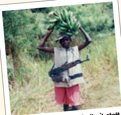
Eine zerstörerische Kindheit statt eine Vorbereitung auf das Leben