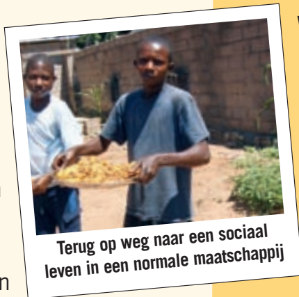
Terug op weg naar een sociaal leven in een normale maatschappij

Wat zal er van hen worden als instellingen, zoals deze van de Jezuïeten, zich niet gaan inzetten voor hun opvang en opvolging? Als ze alleen op zichzelf aangewezen zijn gaan die kinderen na hun ontwapening hun marginaal leven verder zetten en nog meer vervallen in een leven van geweld en misdaad.