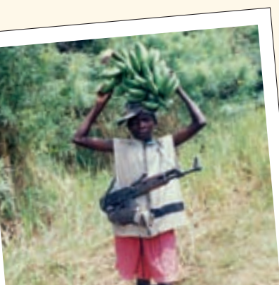
Een vernielde jeugd in plaats van een blijde jeugd die de toekomst toelacht