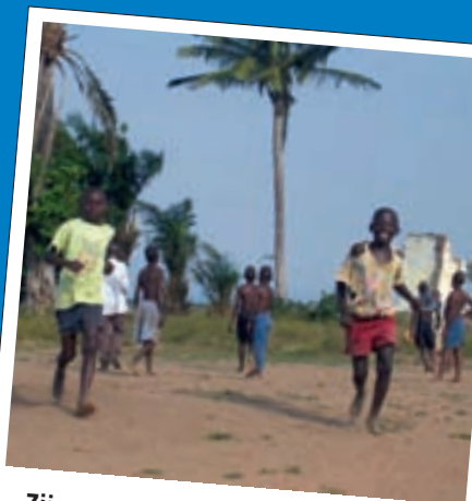
Zij gaan meer nodig hebben dan een stuk braakliggend terrein

ontvingen vanuit Uvira in de Democratische Republiek van Congo. De brief is ons gestuurd door de verantwoordelijke voor de regio der Grote Meren van de Dienst Vluchtelingen van de orde der Jezuiten.