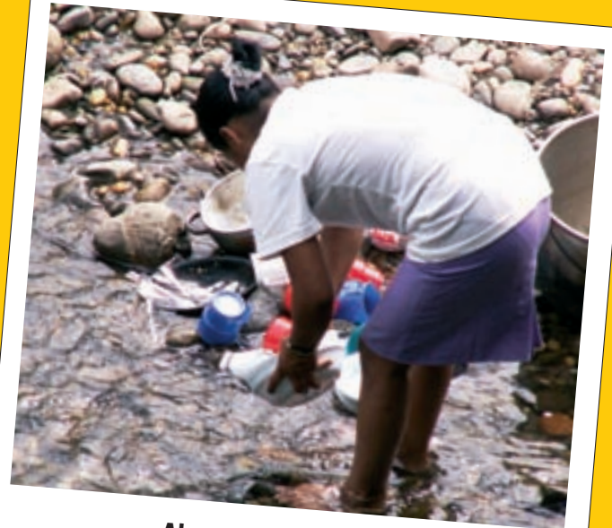
Abwasch im Fluss

« Yapado » (il n'y a pas d'eau = es gibt kein Wasser) ist in Lautschrift der Name eines Projektes in Ecuadorianisch-Amazonien , in der Provinz Pastaza, in 60 km Luftlinie von Puyo (1500 Einwohner). Wir nehmen teil an diesem Projekt um unsere Aktion auszudehnen und um zu verhindern, dass Leute noch von Krankheiten befallen werden, die durch den Genuss von nicht trinkbarem Wasser verbreitet werden.