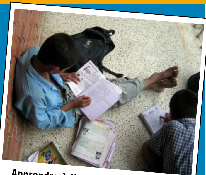
Apprendre à lire, un droit ! Et une des possibilités offertes par les refuges

A Butwal, une petite ville proche de la frontière indienne, 44 enfants ont rejoint