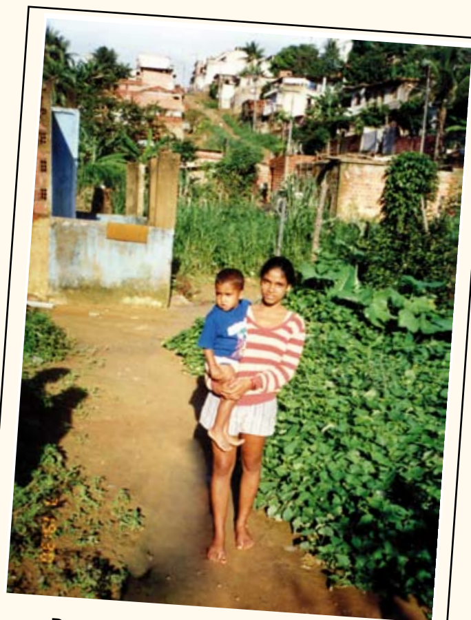
De sloppenwijken waar massa's mensen samenleven in onmenselijke toestanden