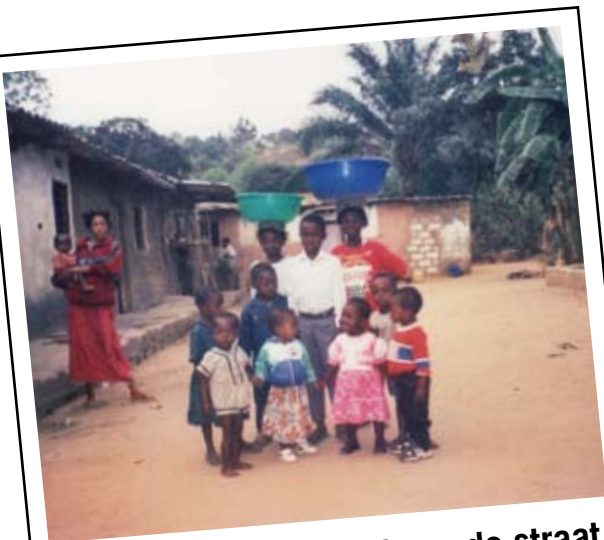
Deze kinderen zijn al van de straat en hebben dus geluk gehad

Tegenover die immense taak ontstaan er wel enkele centra, her en der verspreid, die initiatieven nemen en het aandurven die kinderen een opvang te geven met wat eten en een beetje opvoeding en onderwijs : “met de middelen die men heeft” zegt men dan. Het ISSR (Het Hoger Instituut voor Religieuze Wetenschappen van Kinshasa), dat niet opgericht werd als vormingscentrum voor de jeugd maar wel als vormingscentrum voor animatoren en agenten van Ontwikkelingshulp, ziet ook die nieuwste ontwikkelingen in de steden ontstaan en beseft ook dat dergelijke zaken zeer gevaarlijk zijn, niet alleen voor de christelijke samenleving maar ook voor het