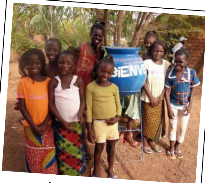
Les filles à l'internat

Nous vous demandons de nous aider, par vos dons, à mener à bien cette action pour l'enfance et pour la vie.