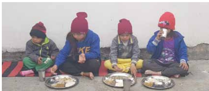
Repas à l'école.

Nous en appelons donc à votre générosité pour construire un avenir meilleur aux enfants les plus démunis du village de Sarupwali.