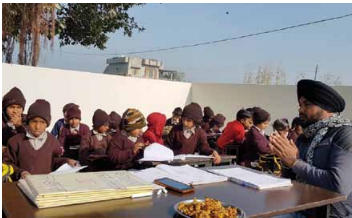
« Classe » à l'extérieur.

Par manque d'espace couvert, seulement deux classes sont situées dans le bâtiment alors que la troisième n'a d'autre alternative que la cour extérieure. Dans ces régions, l'école est plus qu'un lieu d'apprentissage et d'intégration. Elle permet d'aider les parents dans l'alimentation des enfants. C'est dans cette optique qu'un petit local a été aménagé en cuisine sommaire permettant d'offrir un modeste repas par jour aux enfants.