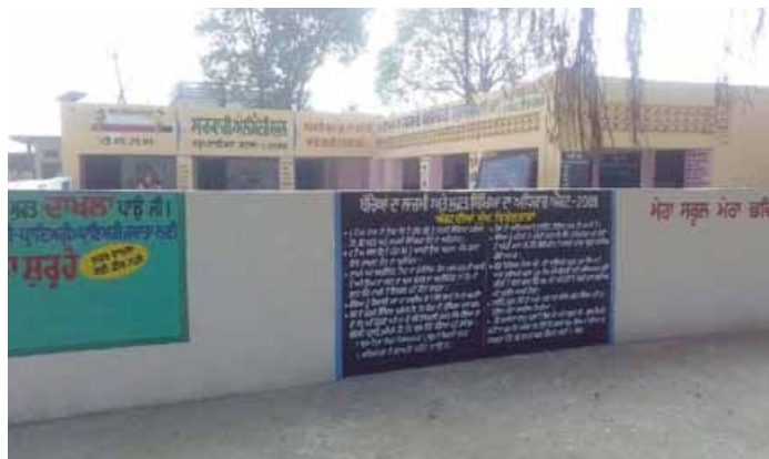
L'aire de jeux se situera juste devant l'école.

De plus, un objectif important de ce projet est d'impliquer majoritairement de la main d'œuvre