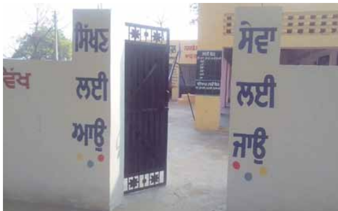
L'entrée de l'école.