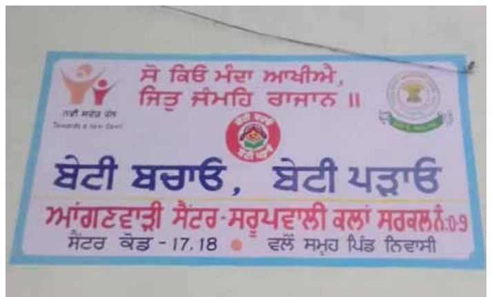
Slogan de l'école « Sauvez votre fille, conduisez-la à l'école ».

L'objectif du projet est en effet de pousser à la scolarisation des enfants en incitant les parents à amener et à maintenir leurs enfants à l'école.